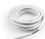
CABLE 4 m